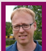
Præsten har ordet

Jeg tror rigtig mange danskere har udlængsel. Mange har det seneste års tid følt sig som løver i et bur – som en flue i en flaske. Fanget.